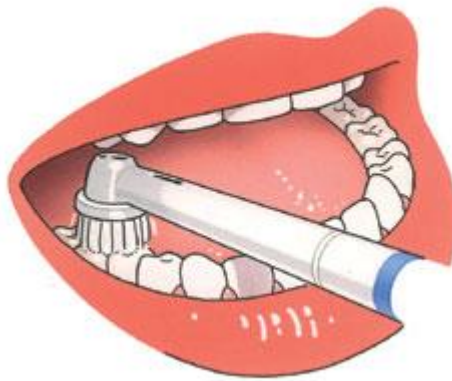
Onderkaak bovenop (kauwvlakken)

Poets altijd tand voor tand en volgens de 3 B 's: B innenkant, B uitenkant en B ovenop!